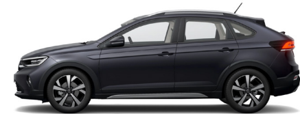
Γκρι Smoky Μεταλλικό