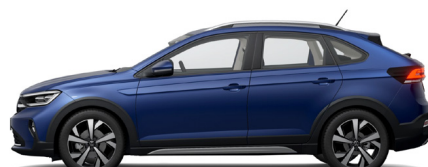
Μπλε Reef Μεταλλικό