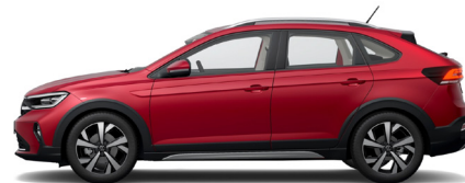
Κόκκινο Kings Μεταλλικό