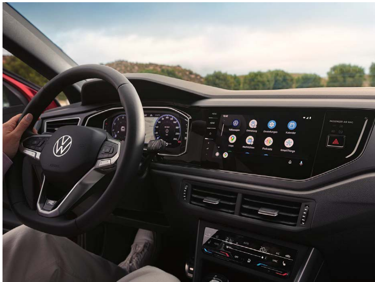
Η εικόνα δείχνει την έκδοση εξοπλισμού R-Line. Θα διατεθεί αργότερα.