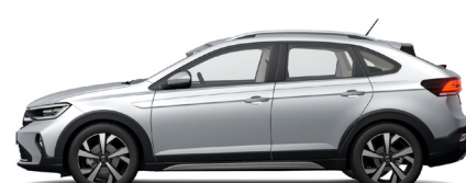
Ασημί Reflex Μεταλλικό