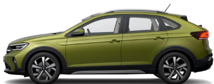
Πράσινο Visual Μεταλλικό