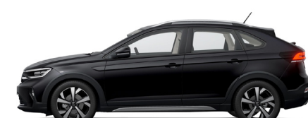
Μαύρο Deep Περλέ