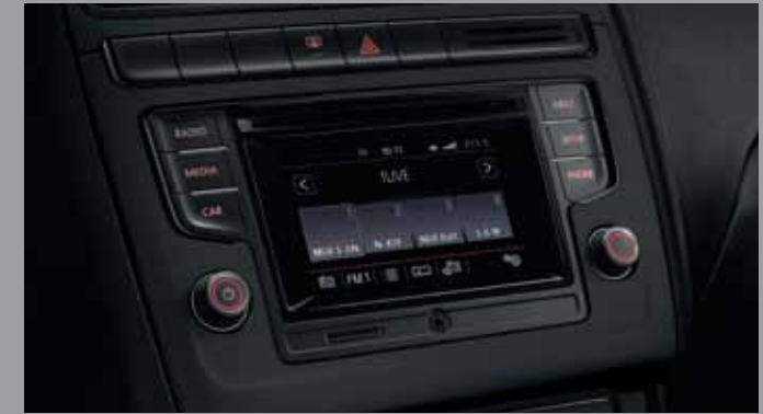
Το ηχοσύστημα "Composition Colour" με έγχρωμη οθόνη αφής TFT 12,7 cm (5"), CD-Player με δυνατότητα ανάγνωσης MP3 και WMA και 6 ηχεία απόδοσης 4 x 20 Watt, είναι επίσης εξοπλισμένο με υποδοχή κάρτας SD, θύρα USB, σύνδεση AUX-IN καθώς και σύνδεση Bluetooth.