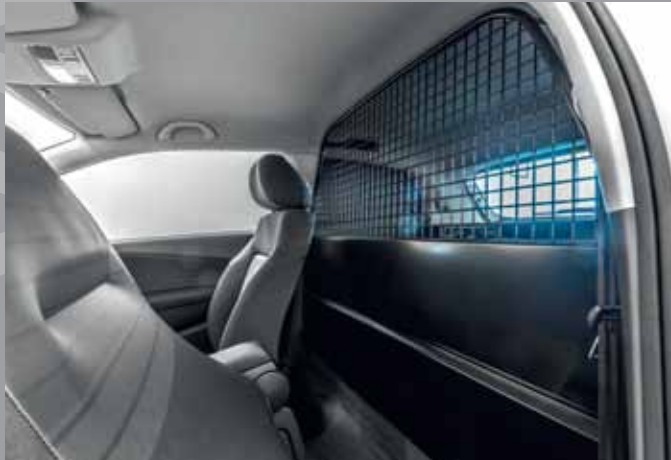
Το στιβαρό διαχωριστικό πλέγμα απομονώνει με ασφάλεια τον χώρο επιβατών από τον χώρο φόρτωσης.

Με ισχυρά στοιχεία τον επιβλητικό και διαχρονικό σχεδιασμό, την έμφαση στη λεπτομέρεια, την υψηλή τεχνολογία και την κορυφαία ποιότητα κατασκευής, το νέο Polo Van αποτελεί τον τέλειο επαγγελματικό συνεργάτη. Ο σχεδιασμός του χαρακτηρίζεται από καθαρές γραμμές, άριστη εργονομία και ιδανική συναρμογή. Το Polo Van είναι ευέλικτο και οικονομικό στην καθημερινή χρήση και πληροί ταυτόχρονα όλες τις επαγγελματικές ανάγκες, όπως είναι οι μεταφορές ή διανομές φορτίων. Έχει σχεδιαστεί για έναν και μόνο λόγο: Για να κάνει την καθημερινότητα στην εργασία σας άνετη και ευχάριστη.