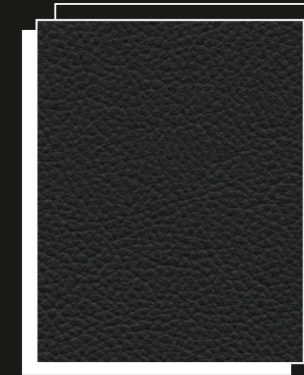
ΔΕΡΜΑ "VIENNA" ΜΑΥΡΟ QW

Τα στοιχεία που αναφέρονται στις αποδόσεις και στις καταναλώσεις αφορούν σε λειτουργία με Super αμόλυβδη ROZ 95, σύμφωνα με το πρότυπο DIN EN 228. Κατά κύριο λόγο χρησιμοποιείται ποιότητα αμόλυβδου καυσίμου ROZ 95 με μέγιστη περιεκτικότητα σε αιθανόλη 10% (E10). Περισσότερες πληροφορίες σχετικά με την συμμόρφωση των καυσίμων E10 θα βρείτε στη διεύθυνση www.volkswagen.de ή στη διεύθυνση www.dat.de/e10liste/e10vertraeglichkeit .